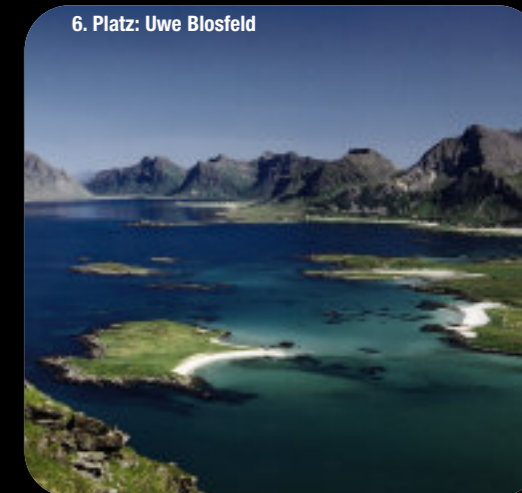
6. Platz: Uwe Blossfeld