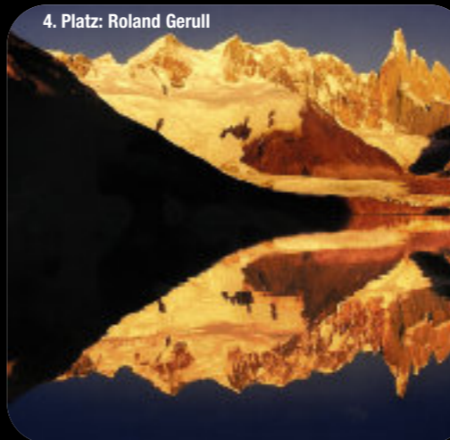
4. Platz: Roland Gerull