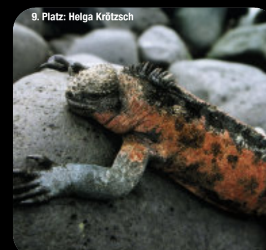
9. Platz: Helga Krötzsch