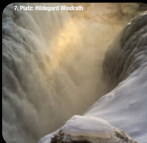
7. Platz: Hildegard Windrath