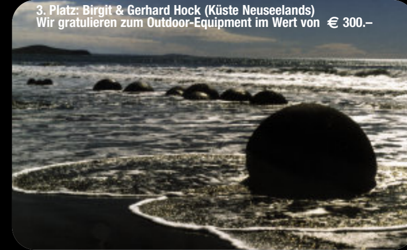
3. Platz: Birgit & Gerhard Hock (Küste Neuseelands) Wir gratulieren zum Outdoor-Equipment im Wert von € 300.–