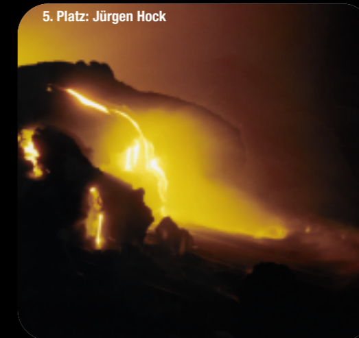
5. Platz: Jürgen Hock