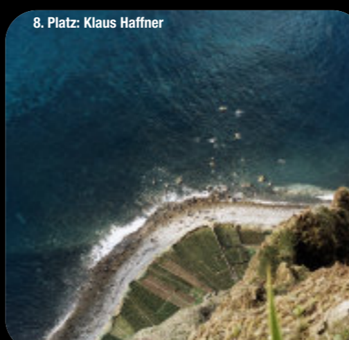
8. Platz: Klaus Haffner