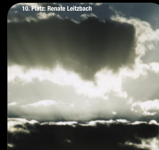
10. Platz: Renate Leitzbach